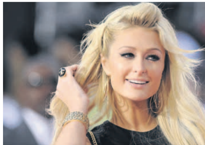
Spät aber doch wurde Hilton von der Realität eingeholt.

NEW YORK. Hotelerbin Paris Hilton hat jetzt gestanden, dass sie dachte, es gäbe den Weihnachtsmann wirklich, bis sie 16 Jahre alt war. Auch heute noch möchte die 28-Jährige an der Illusion festhalten. Sie bittet daher ihre Mutter Kathy Hilton regelmäßig darum, ihr am ersten Weihnachtstag einen Strumpf voller Geschenke aufzuhängen.