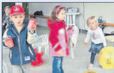
Groß und Klein hatten Ihren Spaß.