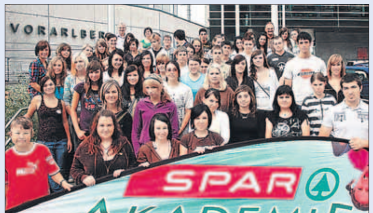
Auftakt für die Lehrlingsausbildung bei SPAR. Bei einem ersten Lehrlingsseminar in der SPAR-Zentrale Dornbirn lernten sich die neuen Lehrlinge kennen.

SPAR ist mit 2.700 Lehrlingen in 14 Lehrberufen Österreichs größter und bester Lehrlingsausbildner. Diesen Herbst haben in Vorarlberg 100 neue Lehrlinge ihre Ausbildung beim größten Lebensmittelhändler im Ländle begonnen. SPAR Vorarlberg hat damit sein Versprechen eingehalten, gerade in schwierigen Zeiten den Jugendlichen noch mehr Ausbildungsplätze anzubieten. Mit 250 Lehrlingen ist SPAR auch der größte Lehrlingsausbildner Vorarlbergs. Für motivierte und engagierte Jugendliche bietet SPAR eine vielfältige Ausbildung in einem krisensicheren Unternehmen, bei dem man auch noch so richtig Karriere machen kann. Lehrstellen bei SPAR sind begehrt. Deshalb startet schon jetzt im Oktober die Suche nach Vorarlberger Jugendlichen, die 2010 bei SPAR lernen wollen. Gute Leistungen werden belohnt: Zusätzlich zum Lehrlingsgehalt zahlt SPAR bei tollen Praxis-Leistungen je nach Lehrjahr bis zu 140 Euro Prämie pro Monat. Für gute Berufsschulzeugnisse gibt's Prämien von bis zu 218 Euro. Wer in der gesamten Lehrzeit ausschließlich gute Praxis-Beurteilungen und in der Schule einen ausgezeichneten Erfolg geschafft hat, bekommt von SPAR den B-Führerschein bezahlt. Heuer sind es in Vorarlberg insgesamt sechs junge Menschen, die sich über den Führerschein freuen konnten. Interessierte Jugendliche und Eltern finden alle Infos und Kontaktmöglichkeiten für die Bewerbung auf www.spar.at/lehre . Unter anderem berichten hier SPAR-Lehrlinge über ihren Alltag bei SPAR.